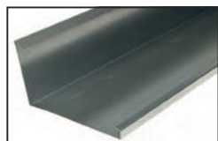
Limahoya para teja curva 90°

*Espesor: 0,6 en Acero 0,65 en Zn 0,8 en Aluminio