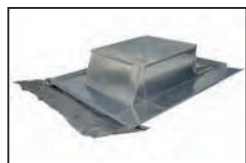
Lima telescópica con plomo