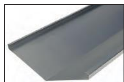
Limahoya para teja curva 135°

*Espesor: 0,6 en Acero 0,65 en Zn 0,8 en Aluminio