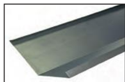
Limahoya para teja plana 135°

*Espesor: 0,6 en Acero 0,65 en Zn 0,8 en Aluminio