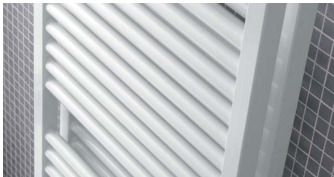
Ejecución de doble capa